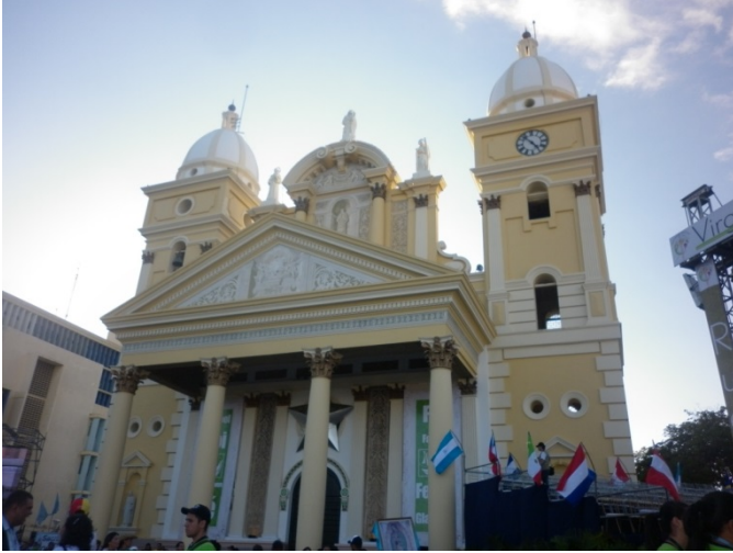
Basilica di Nostra Signora di Chiquinquirà