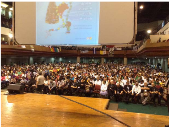
Il Palazzo degli Eventi