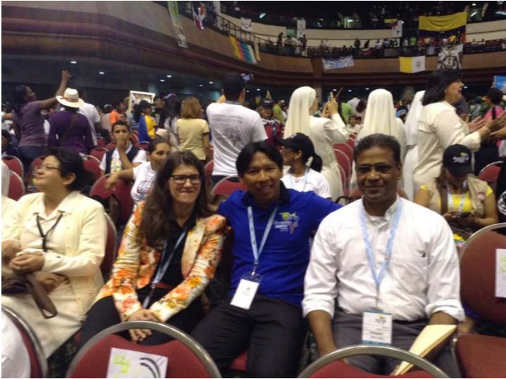
L'incontro con un ex studente della PUU